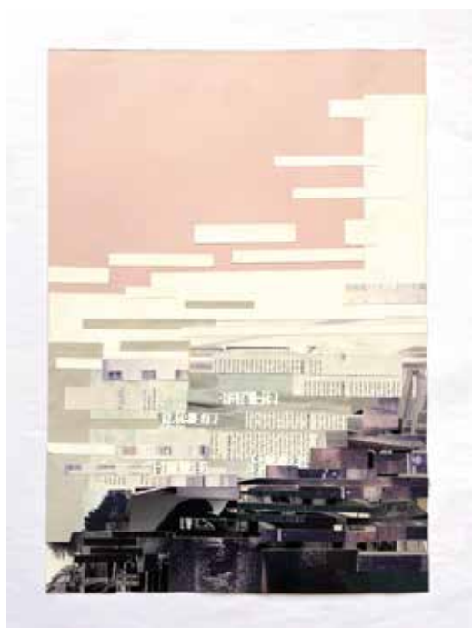
Estudio de paisaje 3