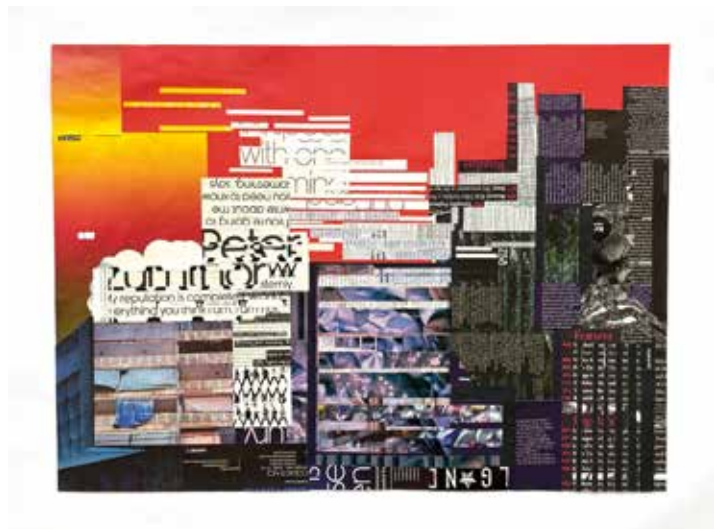
Estudio de paisaje 1