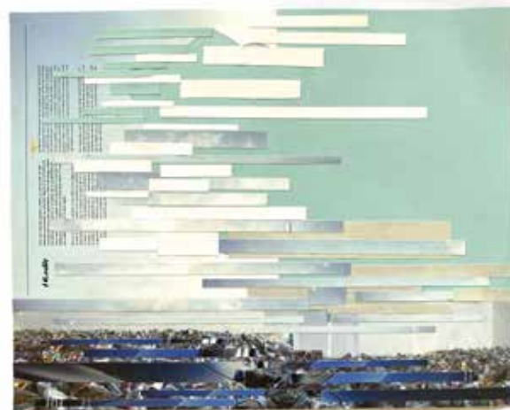
Estudio de paisaje 4